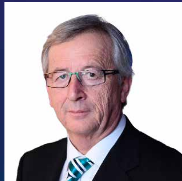
Jean Claude Juncker

UK Başbakan Tony Blair'in Eski İçişleri Bakanı ve Dışişleri Bakanı